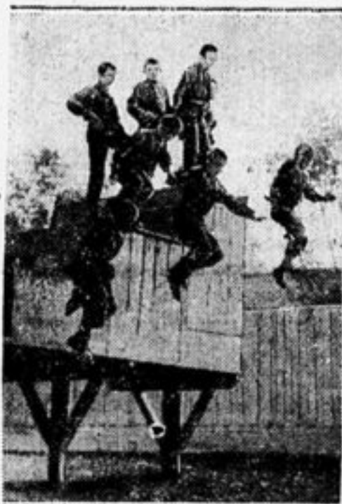
На московской пионерспартакиаде.

5) Сбор литературы для деревни. Отряды проводят сбор