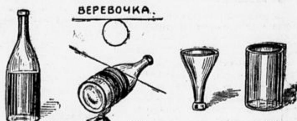
Рис. 1. Рис. 2. Рис. 3.

Из бутылки можно сделать многое. Вот, например, возьмем белую бутылку с прямым дном (см. рис. 1).