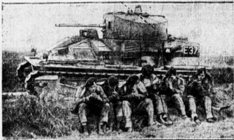
Английские маневры. Солдаты в перерыве боя у своего танка.

По подсчетам командования, бомбовозы разрушили здание оперного театра, уничтожили пристань и