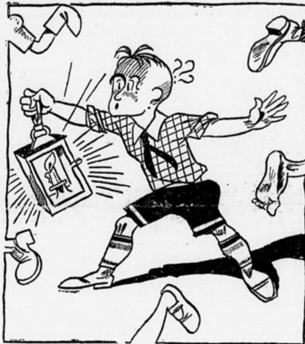
Вожатый в поисках:—куда, куда вы удалились?